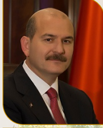
Açılış Konuşmacısı Süleyman SOYLU İçişleri Bakanı