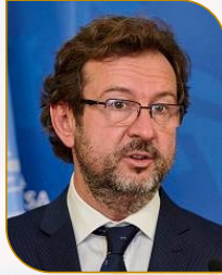
Açılış Konuşmacısı Octavian BIVOL UNDRR Avrupa ve Orta Asya Bölge Ofisi Başkanı