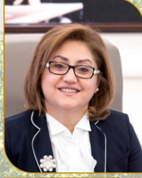
Açılış Konuşmacısı Fatma ŞAHİN Türkiye Belediyeler Birliği Başkanı