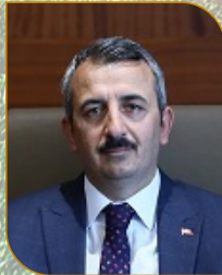
Açılış Konuşmacısı Yunus SEZER Vali AFAD Başkanı