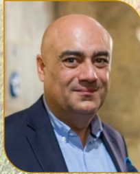
Açılış Konuşmacısı Sukhrob KHOJIMATOV UNDP Türkiye Mükim Temsilci Yardımcısı